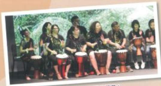
演奏非洲鼓也難不到我們呢！