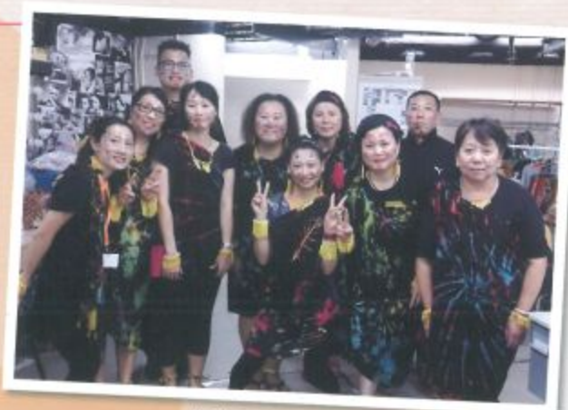
你們認得我們是誰嗎？