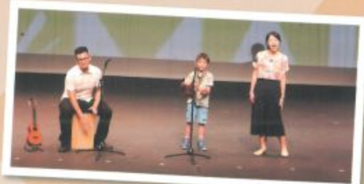
親子合唱，統統三日！