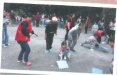
家長學生積極投入，氣氛熱烈！