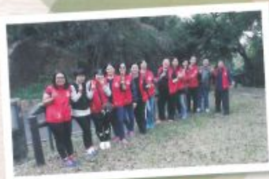
每年都由家教會委員負責一至三年級的集體遊戲，齊心就事成！