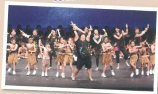
家長忘我的舞蹈，令人印象難忘！