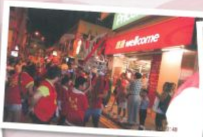
火龍於香港仔和華富邨穿梭，祝願大家身體健康！