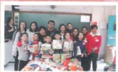
家教會委員及家長義工與學生一起歡度聖誕節。