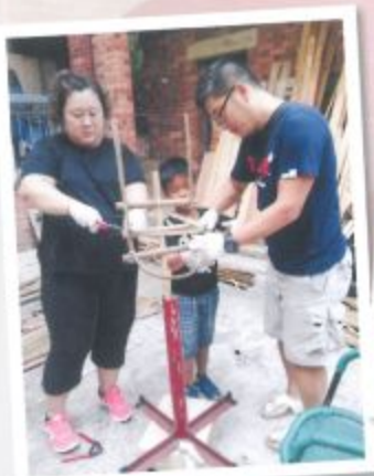
大家齊心合力製作火龍。