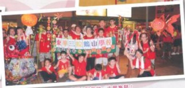
我們人強馬壯，士氣高昂！